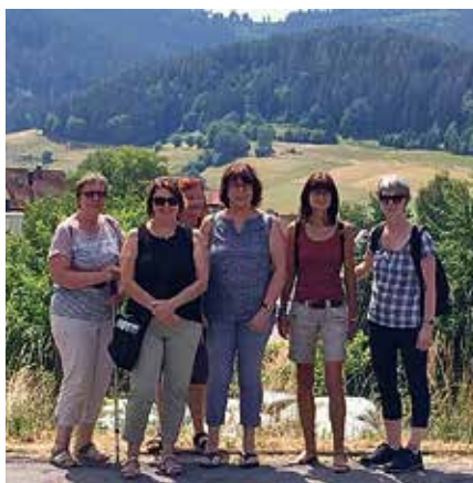
Die Frauen der HerzBande bei ihrem alljährlichen Ausflug

Die HerzBande Nordbaden/Karlsruhe, eine der größten von der Kinderherzstiftung unterstützten Selbsthilfegruppen rund um angeborene Herzfehler, veranstaltete auch 2018 wieder ihren traditionellen Mütterausflug. Bei herrlichem Wetter ging es morgens mit der Bahn nach Baiersbronn, wo die Teilnehmerinnen nach einem Spaziergang gemütlich essen gingen. Darauf folgte ein Besuch in Hauff's Märchenmuseum und ein Fußmarsch nach Klosterreichenbach. Hier kehrten die Frauen in einer Eisdielen ein, bevor sie die Heimfahrt antraten.