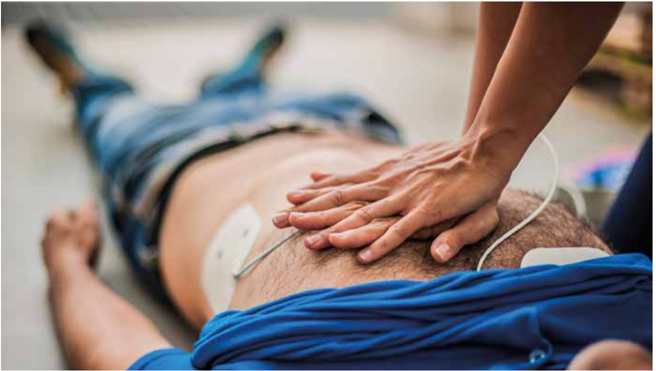
Lebensrettend: die Herzdruckmassage

Die frühe Behandlung der koronaren Herzkrankheit ist der beste Schutz vor Herzinfarkt und plötzlichem Herztod. Wesentliche Therapiebausteine sind Medikamente, die Implantation von Stützen (Stents), die verengte Gefäße offen halten, und, seltener, die Bypassoperation, das chirurgische Anlegen von Umgehungsgefäßen. Wichtig ist es darüber hinaus, alle Risikofaktoren konsequent anzugehen, die zum Entstehen der koronaren Herzkrankung entscheidend beitragen. Dazu zählen hoher Blutdruck, ein hoher Cholesterinspiegel oder die Zuckerkrankheit Diabetes mellitus. Lebensstiländerungen – nicht rauchen, sich gesund ernähren, ausreichend bewegen – sind weitere wichtige Maßnahmen, um der koronaren Herzkrankheit und ihren schweren Folgen vorzubeugen.