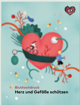
Broschüre Bluthochdruck Bestellnr.: BR01

Telefon: 069 955128-400 oder online herzstiftung.de/bestellung