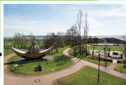
Nachsorgeklinik Tannheim Gemeindewaldstraße 75 78052 VS-Tannheim www.tannheim.de

Grafik: DHS / Ramona Unguranowitsch