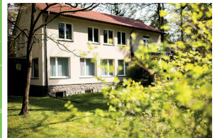
Kindernachsorgeklinik Berlin-Brandenburg Bussardweg 1 16231 Bernau-Waldsiedlung www.knkbb.de