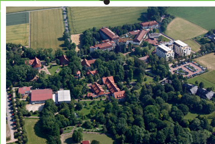
Klinik Bad Oexen – Kinderhaus Oexen 27 32549 Bad Oeynhausen www.badoexen.de