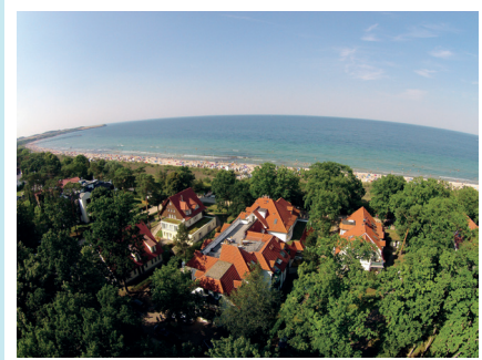
Ostseeklinik Boltenhagen Ostseeallee 108 23946 Ostseebad Boltenhagen www.ostseeklinik-boltenhagen.de

Standorte der medizinischen Rehabilitationseinrichtungen für herzkrankte Kinder und Jugendliche