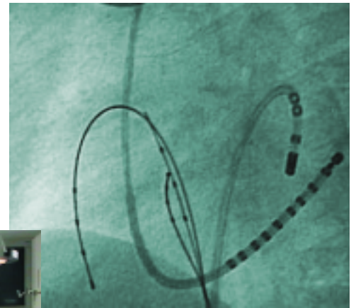
oben: Röntgenbild bei Ablation. links: Monitor bei einer Ablation.

Besteht hingegen ein WPW-Syndrom , so muss abgeklärt werden, ob eine schnelle Überleitung möglich ist. Falls ja, ist eine elektrophysiologische Untersuchung und eine Ablation notwendig. Falls nein, muss nicht unbedingt eine Therapie eingeleitet werden.