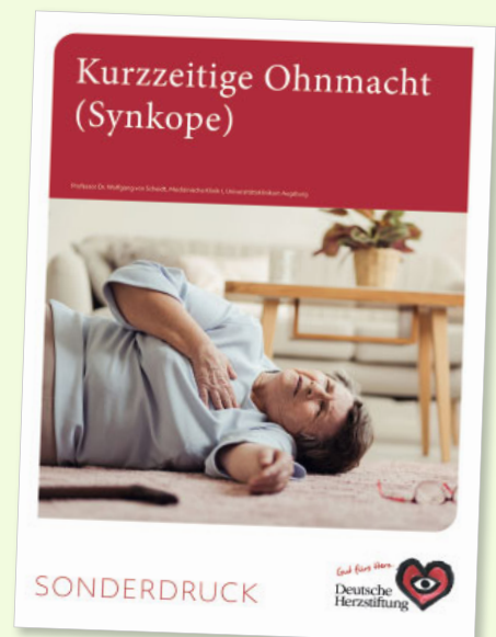
Kurzzzeitige Ohnmacht (Synkope) Bestellnr.: SD09*

*Für Mitglieder ist die Zusendung kostenfrei. Andernfalls bitten wir um eine Spende für die Produktions- und Versandkosten: www.herzstiftung.de/spenden