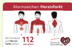
Alarmzeichen: Herzinfarkt Bestellnr.: AW04*